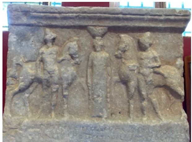
Bas-relief représentant Hélène et les Dioscures

D'après le témoignage du voyageur antique Pausanias, le site était occupé autrefois par un étrange monument : le trône d'Apollon. Entourant une statue du dieu 500 ans plus ancienne, ce trône du VI e siècle avant notre ère était orné de scènes mythologiques très nombreuses. Les archéologues essaient actuellement de rétablir ce monument de 13 mètres de haut !