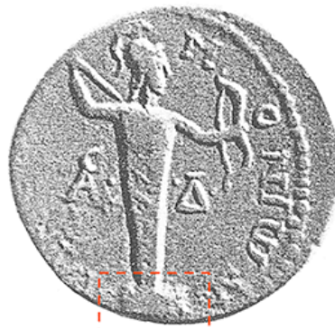
Monnaie romaine représentant la statue d'Apollon